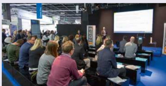
De eerste editie van Career Day in 2015 was een succes, aldus de organisatie.