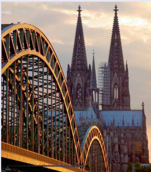
De Hohenzollernbrücke, met daarachter de Kölner Dom.