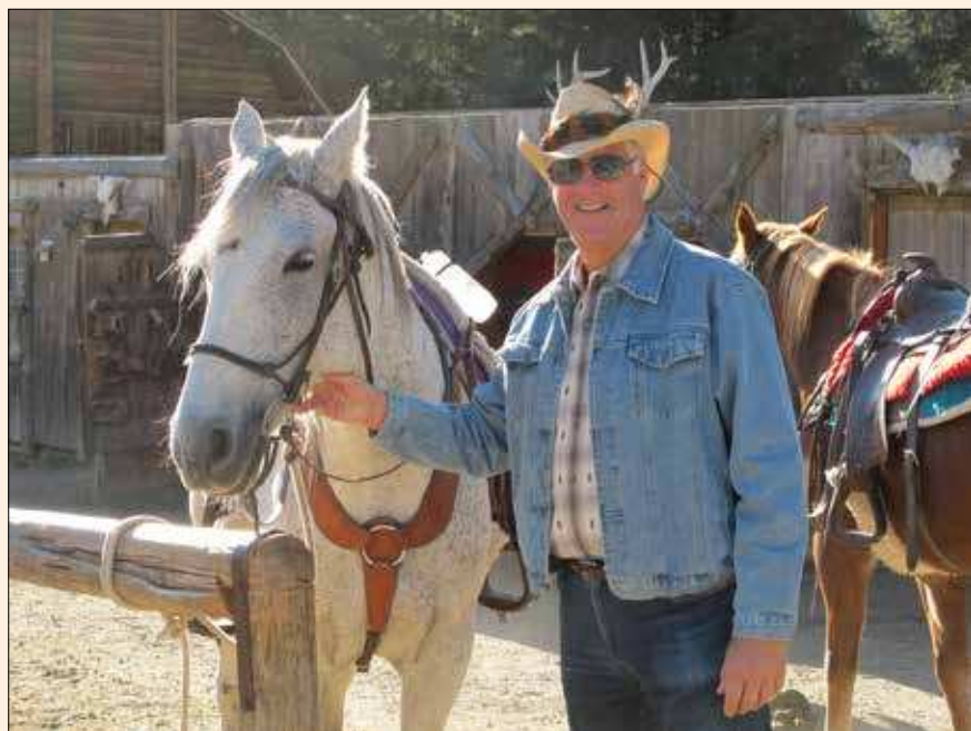
El especialista después de montar a caballo.

Es difícil de recordar, pero probablemente la rehabilitación de una dentadura implantosoportada en