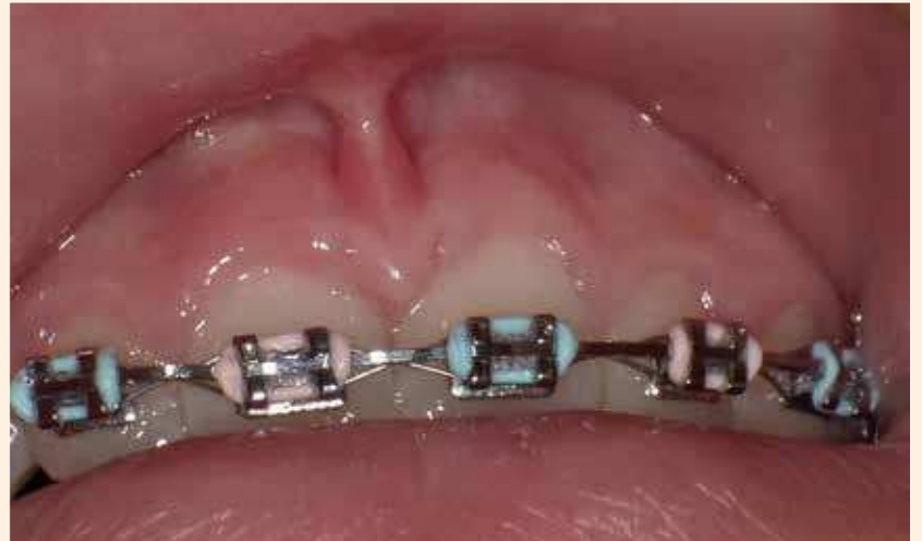
Figura 1. Imagen pre-tratamiento del frenillo con la papila algo agrandada.

Una niña de 13 años sometida a tratamiento de ortodoncia me fue referida por el ortodoncista que notó un «tirón del frenillo» que no permitiría el cierre adecuado del diastema entre los incisivos centrales superiores derecho e izquierdo. Las fotos ilustran lo siguiente: