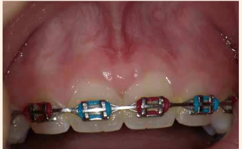
Figura 3. Imagen un mes después del tratamiento con perfecta cicatrización.