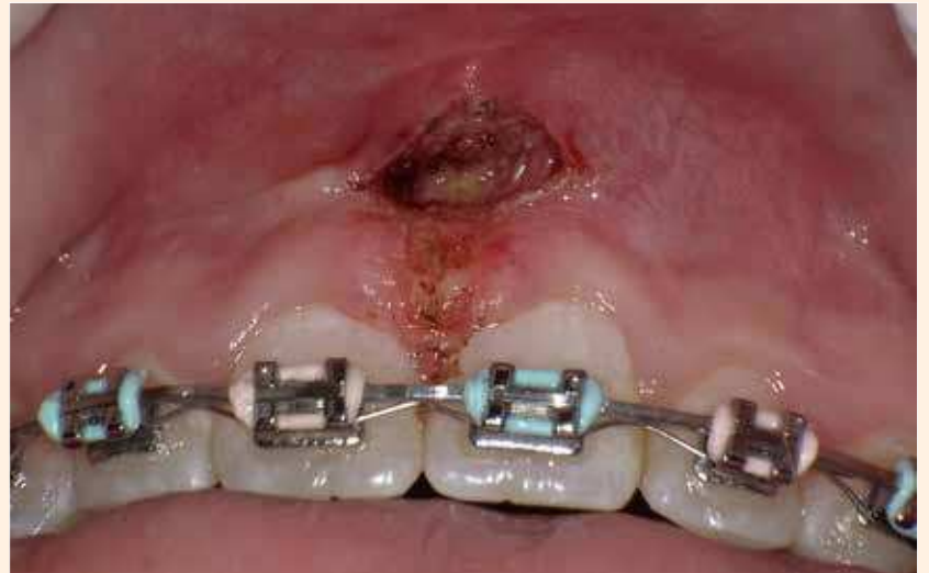
Figura 2. Reducción de la papila y liberación del frenillo. El tratamiento se realizó utilizando un láser de diodo para tejido blando Picasso (AMD Lasers), que permitió el mantenimiento del sitio quirúrgico casi sin sangre.