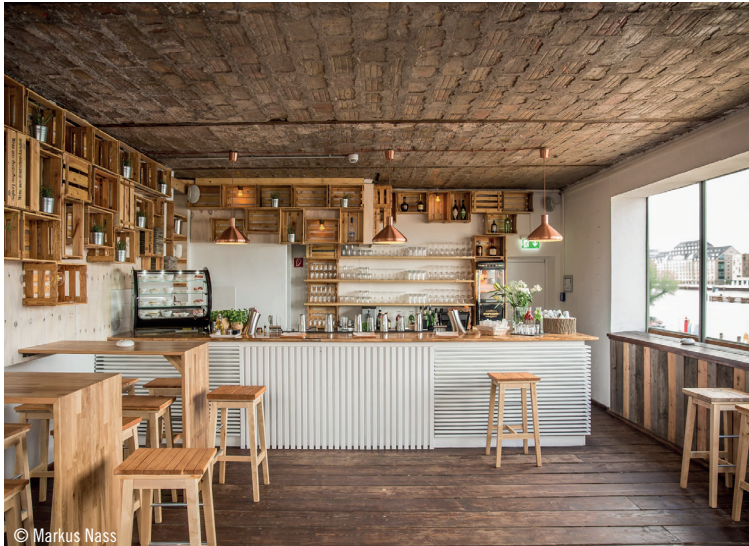
Die Escobar ist ein Ausleger des Badeschiffs und bietet einen Panoramablick über die Spree.