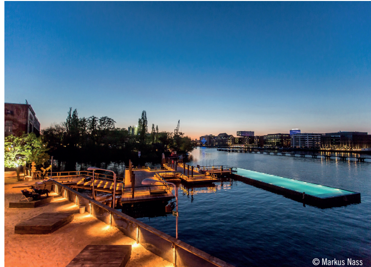
Badeschiff: Ein verankerter Lastkahn fungiert als schwimmender Pool.